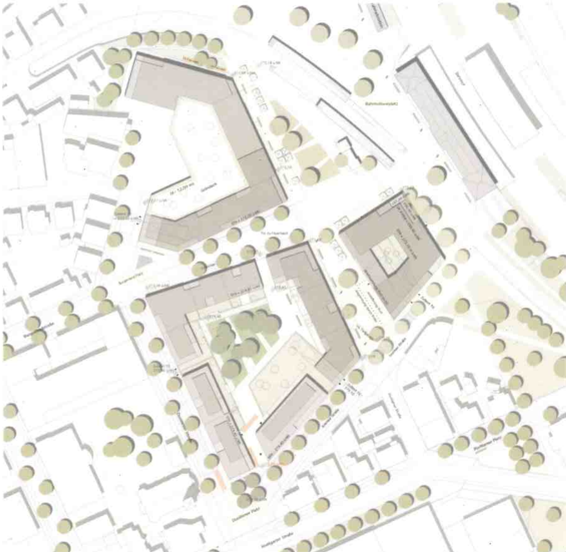
Abbildung 2: Weiterentwickelter Entwurf Architekturbüro Thomas Schüler, 01.09.2017

Im Mittelpunkt des Strukturwandels des östlichen Zentrums von Feuerbach steht die Umwandlung des ehemals überwiegend gewerblich genutzten Gebiets westlich des Feuerbacher Bahnhofs. Die Neustrukturierung hat zum Ziel, ein hochwertiges Mischgebiet mit verdichtetem, innerstädtischen Wohnen in zentraler, verkehrsgünstiger Lage für unterschiedliche Zielgruppen zu entwickeln. Dieses Ziel soll durch die planungsrechtliche Umsetzung des weiterentwickelten städtebaulichen Wettbewerbs (Architekturbüro Thomas Schüler, 2017) in Verbindung mit der überarbeiteten Freiraumgestaltung (Landschaftsarchitekten faktorgruen, 2017) erreicht werden. Die städtebauliche Konzeption fügt sich durch eine stringente, zum Wiener Platz hin ansteigende Blockrandbebauung (ca. 16 m bis ca. 22 m Höhe) in den städtebaulichen Kontext ein.