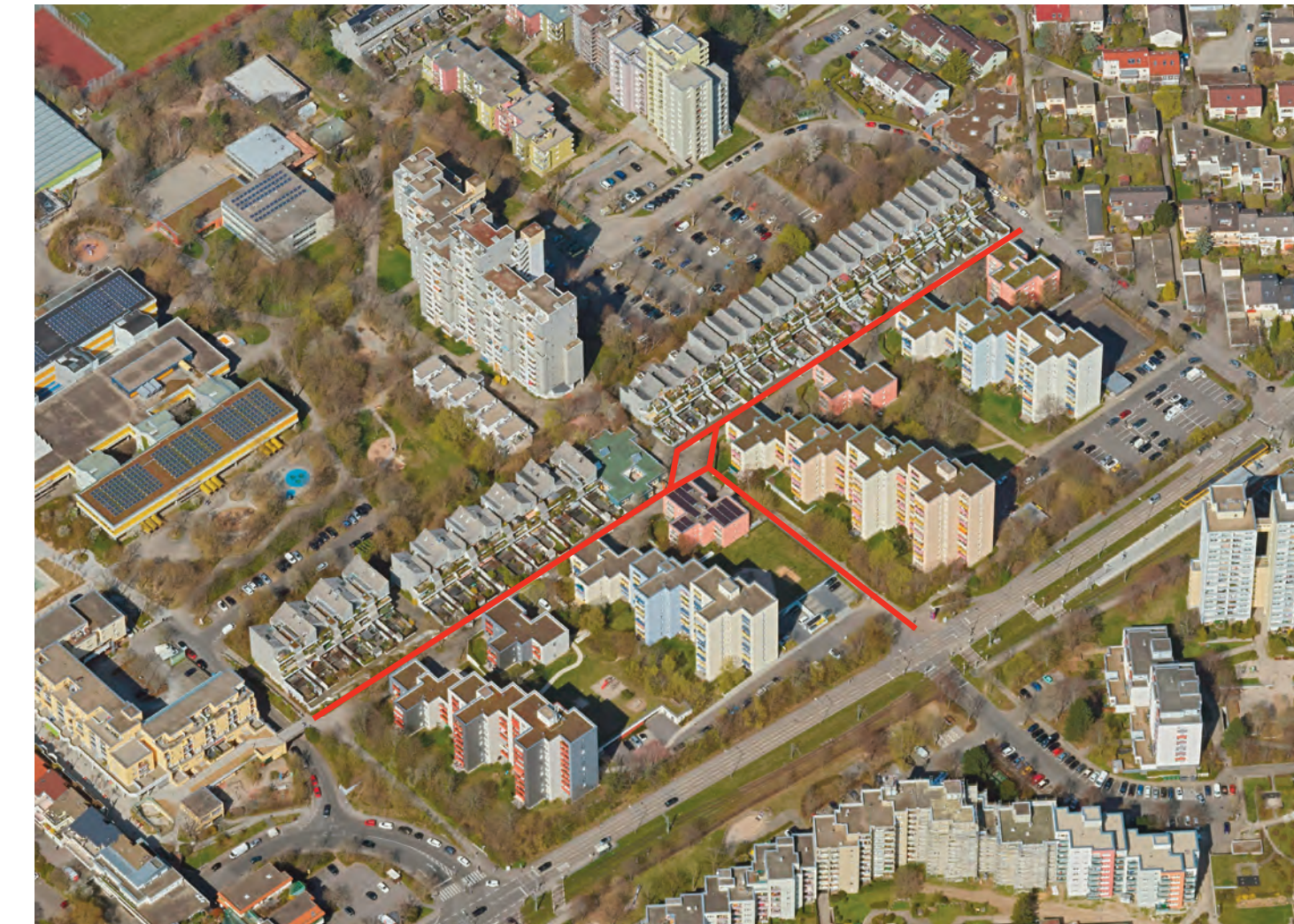
Das Gestaltungskonzept „Rotes Band-Plätze-Adressen/Bäume“ im Überblick