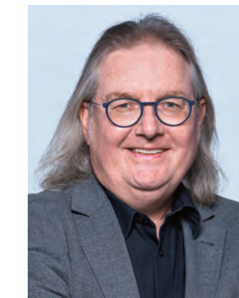
Peter Pätzold Bürgermeister für Städtebau, Wohnen und Umwelt