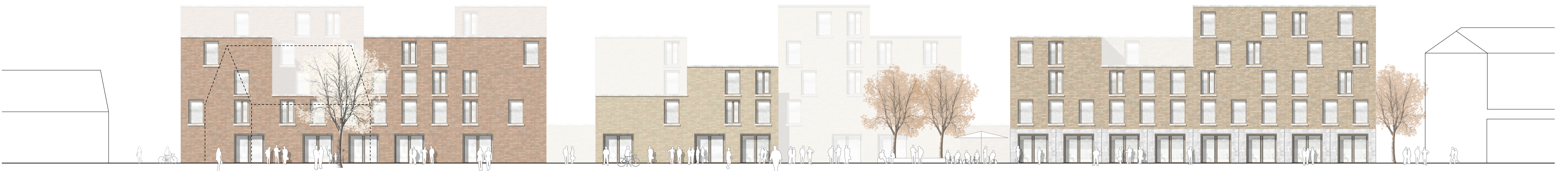
Ansicht von Nordost M 1:200