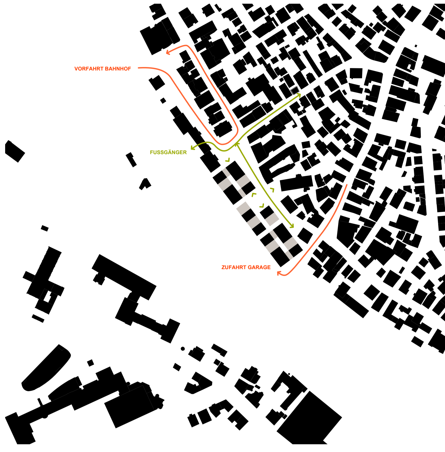
Strukturplan mit Erschließungskonzept M 1:2000

Das Postareal liegt an einer interessanten Schnittstelle Untertürkheims: Am Rande des alten Ortskerns, jedoch in der Mitte des „eigentlichen“ Untertürkheim zwischen gewachsener Stadt, Schulzentrum, Wellfirma und Weinbaugelände und damit mitten in einem für Stuttgart so typischen Konglomerat. Das Potential zur „Neuen Mitte“ ist also vorhanden, zumal zentrale Funktionen wie Bahnhof, Kirche, Rathaus und Stadtbibliothek momentan ohne besondere räumliche Ausprägung im Ortsgebiet verteilt sind. In diesem Sinne wird zusätzlich zu den geforderten Funktionen an zentraler Stelle eine kleine Markthalle mit Bürgerzentrum als öffentliches Herz des Areals vorgeschlagen. Ausgehend von der beschriebenen Lage des Areals an einer Schnittstelle verschiedenster Strukturen, wird die Neubebauung in einem ersten Schritt grundsätzlich als formal eigenständiges Quartier entworfen, das jedoch in der weiteren Durcharbeitung starke Bezüge zum Kontext aufnimmt. Die geschieht über: 1. Die Ausbildung der öffentlichen Räume 2. Die Körnung der Neubauten 3. Die Materialität der Fassaden