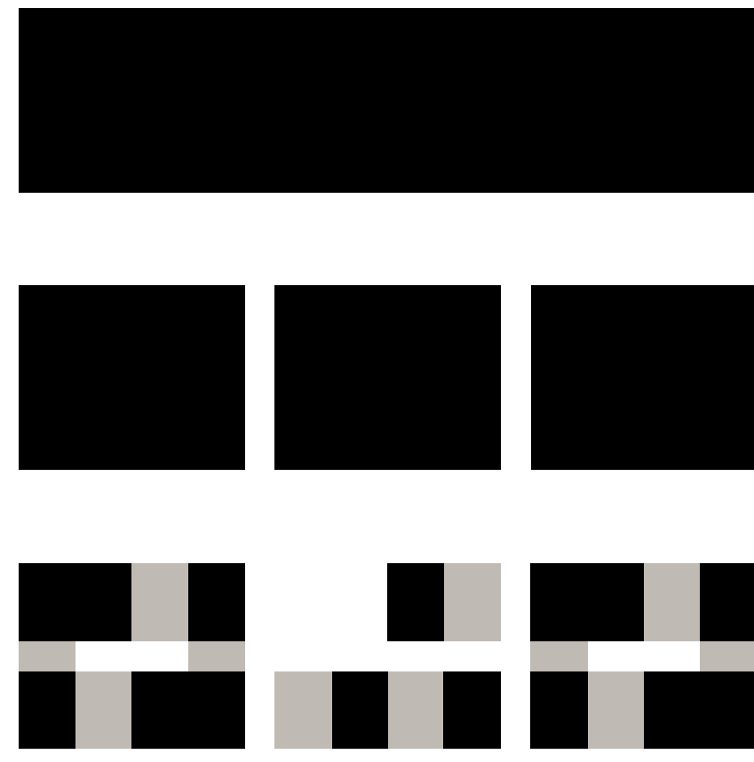
Entwicklung der Struktur