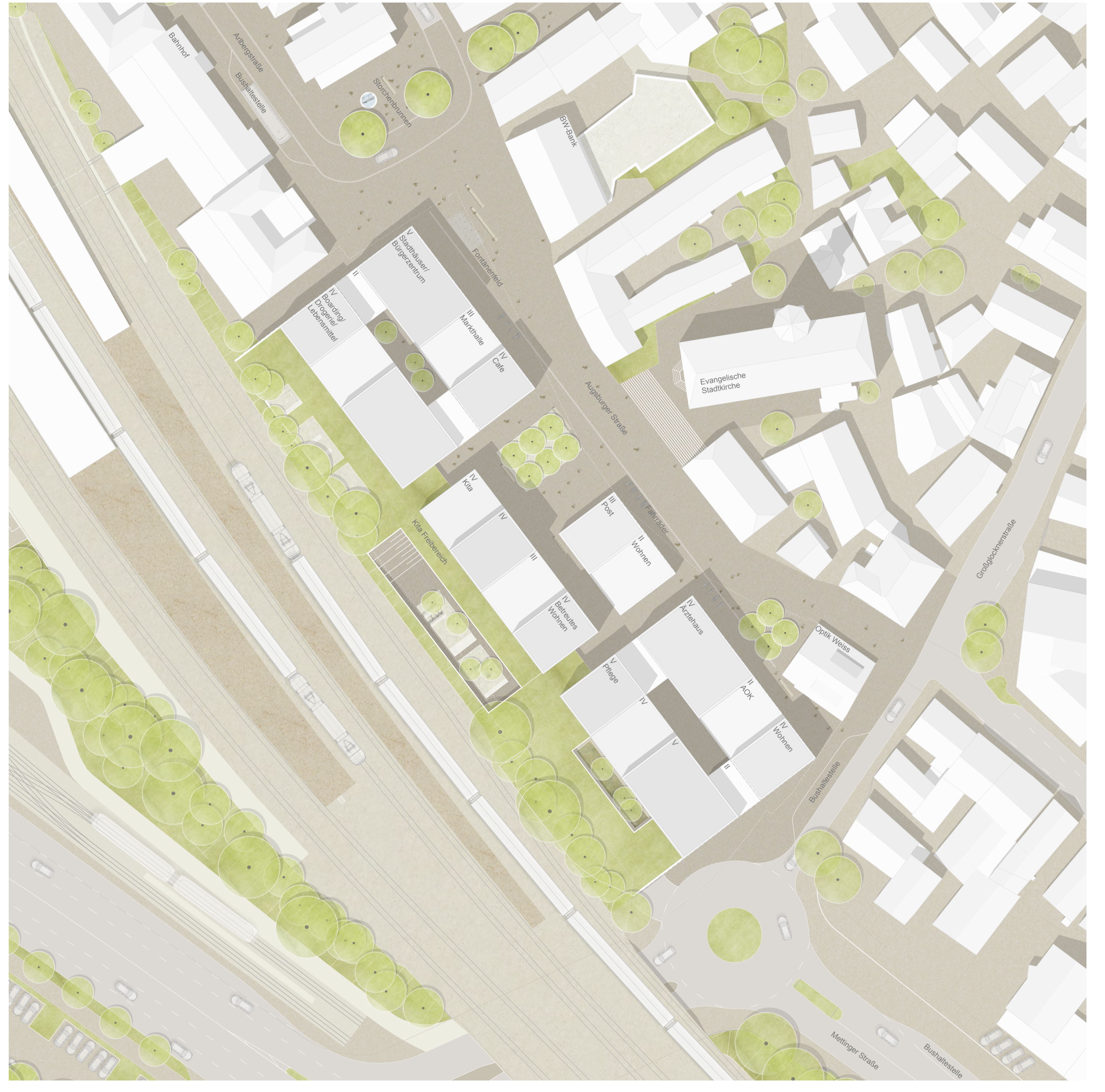
Lageplan M 1:500