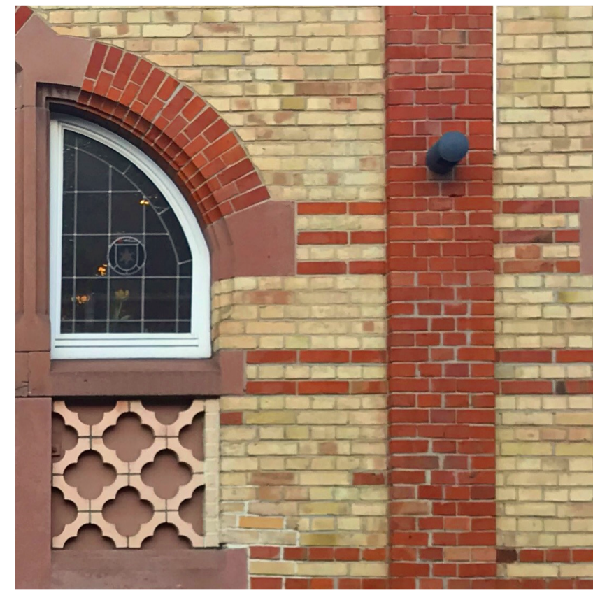
Materialität im Kontext

Das Postareal liegt an einer interessanten Schnittstelle Untertürkheims: Am Rande des alten Ortskerns, jedoch in der Mitte des „eigentlichen“ Untertürkheim zwischen gewachsener Stadt, Schulzentrum, Wellfirma und Weinbaugelände und damit mitten in einem für Stuttgart so typischen Konglomerat. Das Potential zur „Neuen Mitte“ ist also vorhanden, zumal zentrale Funktionen wie Bahnhof, Kirche, Rathaus und Stadtbibliothek momentan ohne besondere räumliche Ausprägung im Ortsgebiet verteilt sind. In diesem Sinne wird zusätzlich zu den geforderten Funktionen an zentraler Stelle eine kleine Markthalle mit Bürgerzentrum als öffentliches Herz des Areals vorgeschlagen. Ausgehend von der beschriebenen Lage des Areals an einer Schnittstelle verschiedenster Strukturen, wird die Neubebauung in einem ersten Schritt grundsätzlich als formal eigenständiges Quartier entworfen, das jedoch in der weiteren Durcharbeitung starke Bezüge zum Kontext aufnimmt. Die geschieht über: 1. Die Ausbildung der öffentlichen Räume 2. Die Körnung der Neubauten 3. Die Materialität der Fassaden