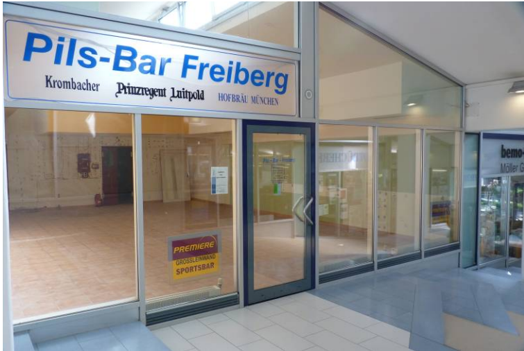
Außenansicht Passage II