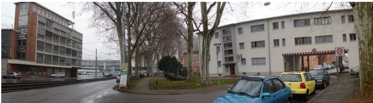
Zäsur der Inselstraße und Siedlung Inselstraße