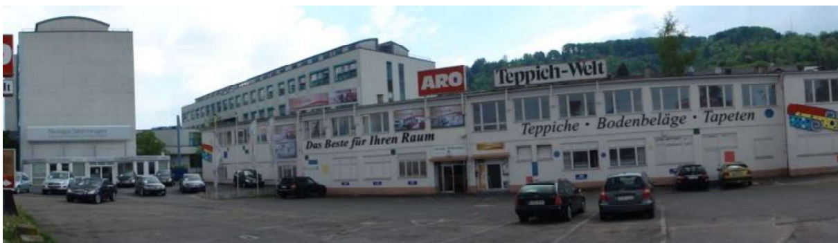
Gewerblicher Bestand an der Ulmer Straße