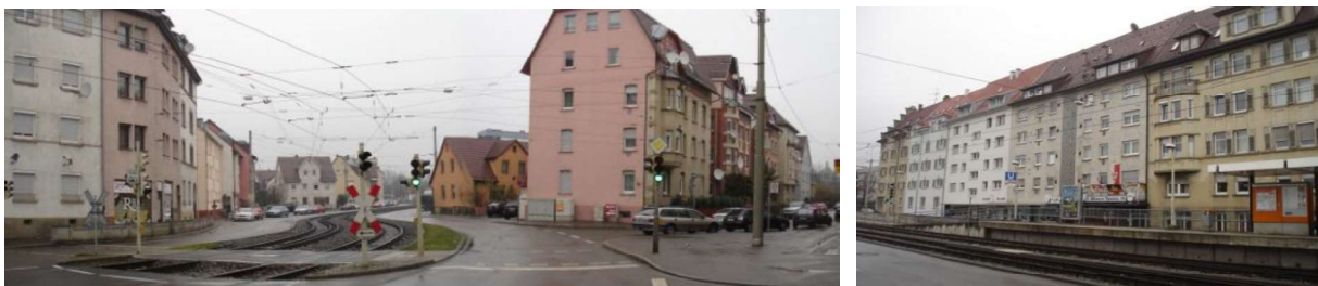
Zäsur der Wasenstraße, Wohnbebauung im Bereich des Ortsauftakts von Wangen