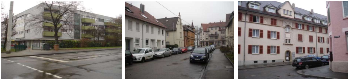
Defizite in den Wohnbeständen unterschiedlichen Alters