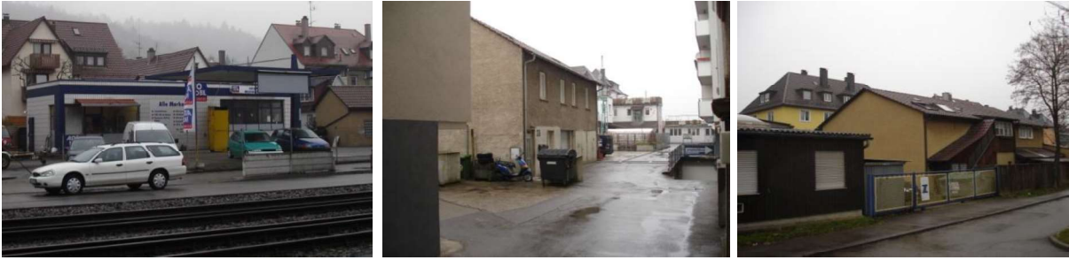
Gemengelage im Bereich des Gebiets