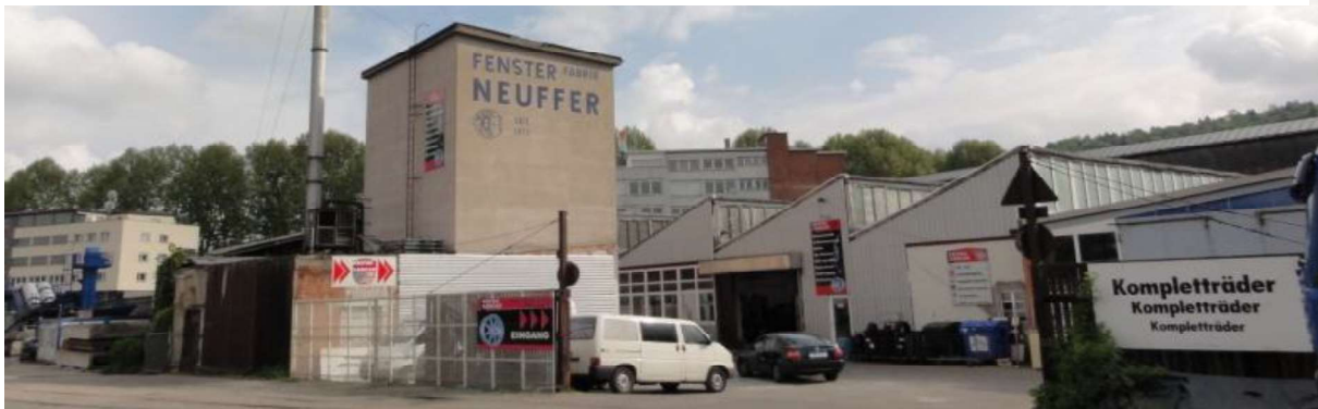
Heterogener gewerblicher Bestand an der Straße Viehwesen