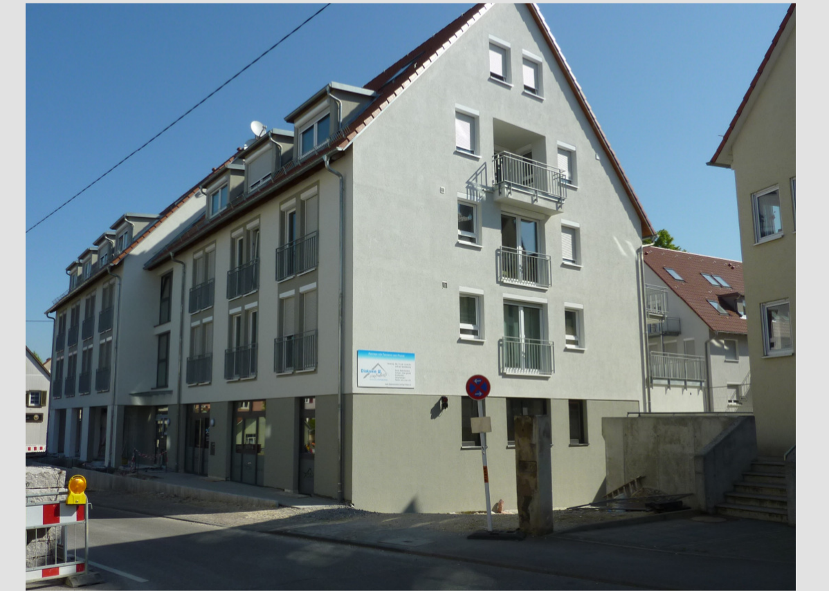
Schoellstraße 3 - 2011