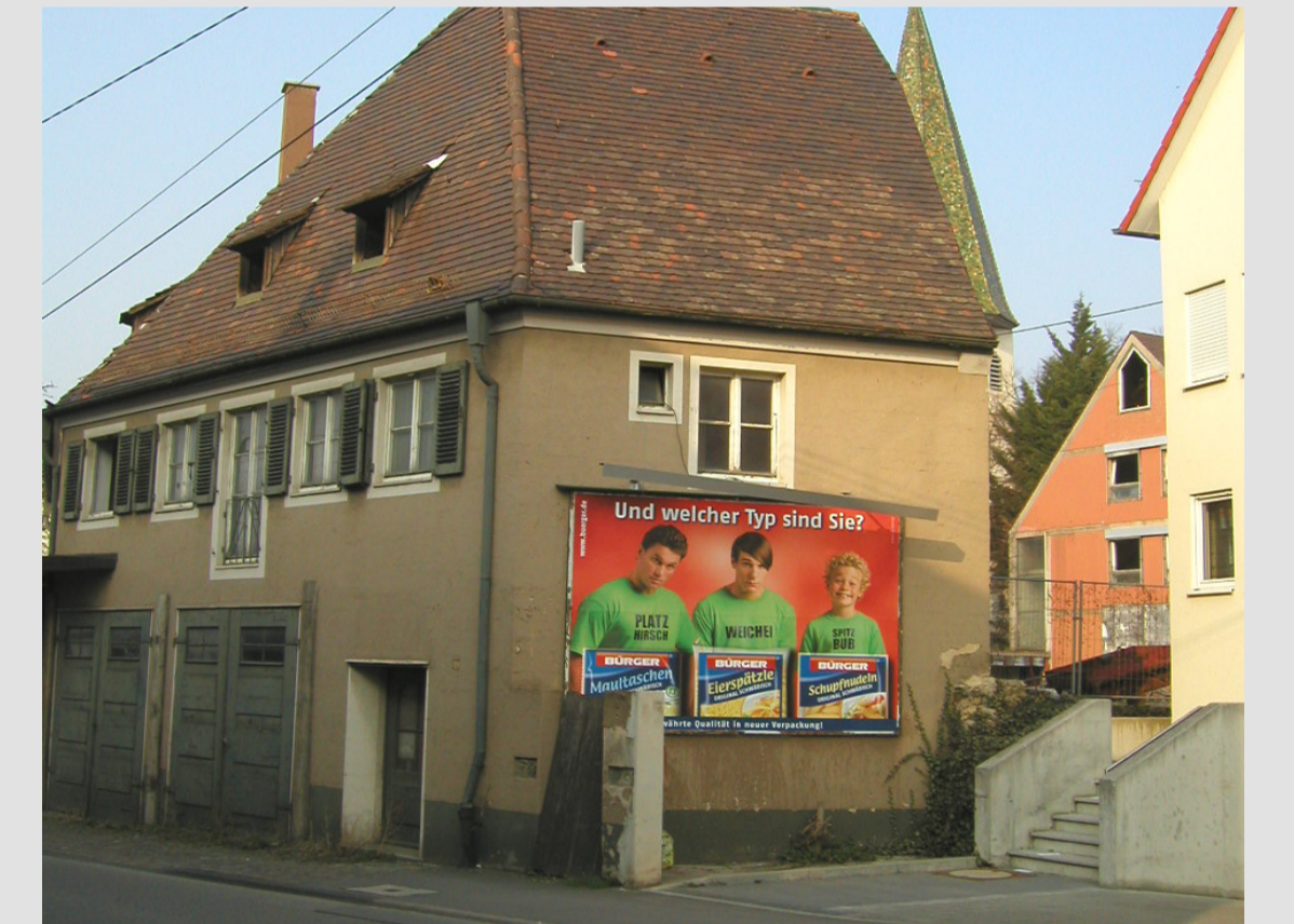
Schoellstraße 3 - 2007