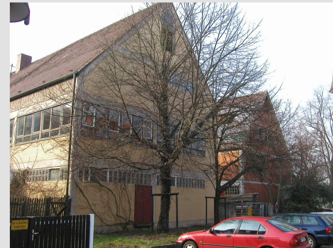
Mönchhof 4, 2 vor der Modernisierung - 2007