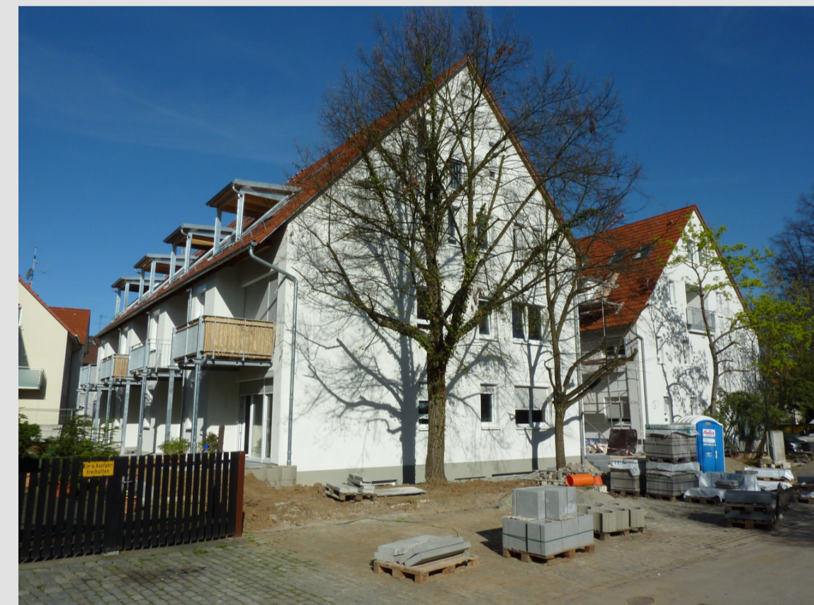
Mönchhof 4, 2 nach der Modernisierung - 2011