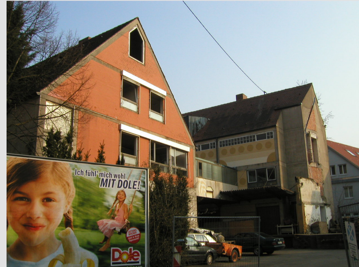
Mönchhof 2, 4 vor der Modernisierung - 2007