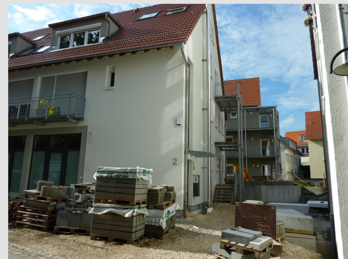
Mönchhof 2, 4 nach der Modernisierung - 2011